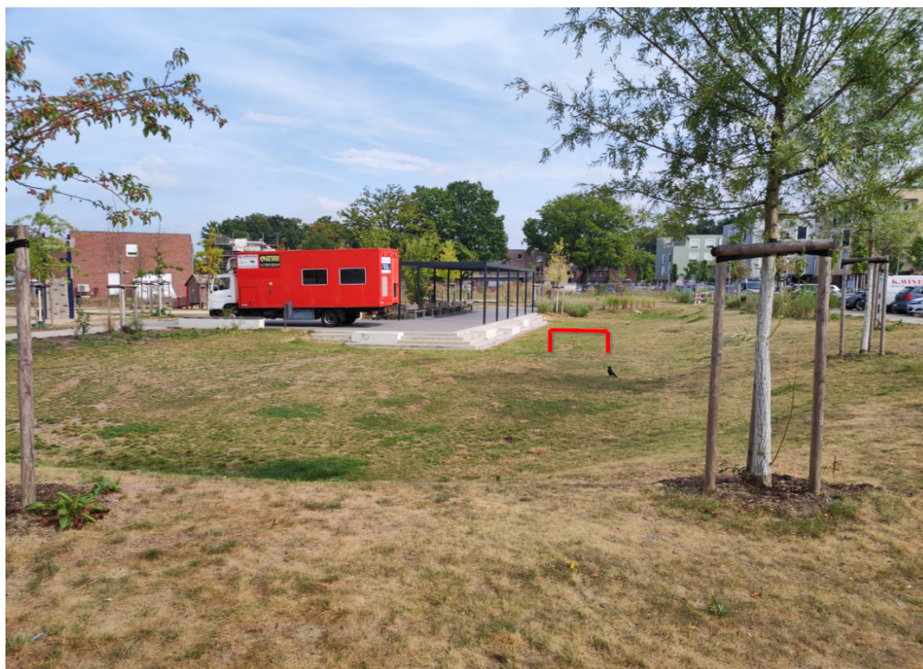
Links der Spielplatz, das Spielmobil von Jugend Kids & Co, das den Spielplatz anfährt, und rechts die Multifunktionsfreifläche, die mit einem Rahmentor ausgestattet werden soll.

CDU-Kreisverband Münster e.V. Mauritzstraße 4-6 • 48143 Münster Telefon (02 51) 4 18 42-0 Telefax (02 51) 4 18 42-44 post@cdu-muenster.de • www.cdu-muenster.de